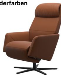
„Paloma“ New Cognac