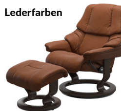
„Paloma“ New Cognac