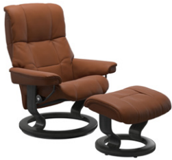
„Paloma“ New Cognac