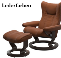
„Paloma“ New Cognac