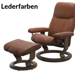
„Paloma“ New Cognac