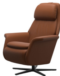
„Paloma“ New Cognac