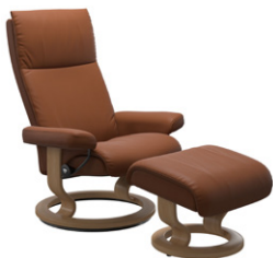
„Paloma“ New Cognac